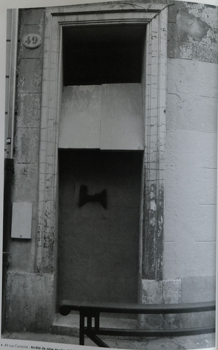
• 49 rue Consolat : Arrêté de mise en sécurité du 04/02/2022