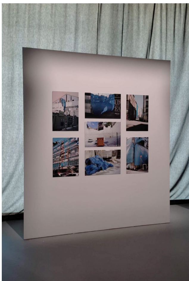
Vue de l'exposition Hasard objectif , Galerie de l'ENSP, Arles 2022.