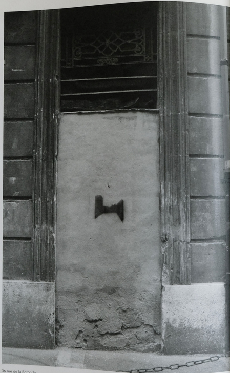
36 rue de la Rotonde