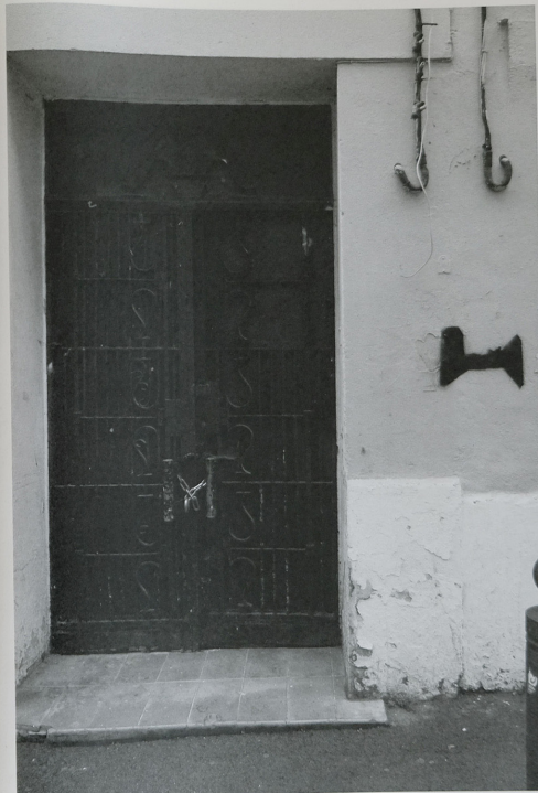
15 rue Curial