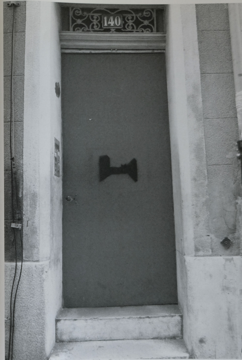
• 140 rue Consolat : Arrêté de mise en sécurité du 26/04/2022